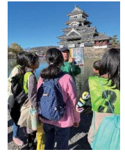
松本城の話しを聞く