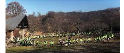
アルプス公園でダンス