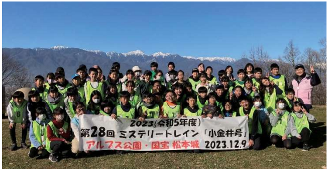
2023(令和5年度) 第28回 ミステリートレイン「小金井号」アルプス公園・国宝松本城 2023.12.9