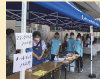
公民館本館まつり

◆ジュニアリーダースクラフ サマーキャンプ 実施日 8月19日(土)~20日(日) 場所 松原山荘 参加人数 45名 (小学生15・JL18・育成12) この夏、ジュニアリーダーが企画・運営するサマーキャンプが、4年ぶりに開催されました。松原山荘に到着後、まず昼食のBBQに使う串を、竹を削って作りました。全員完成した串で、肉や野菜をゲット。午後は、山荘の下を流れる川にて水遊び。 この夏、ジュニアリーダーが企画・運営するサマーキャンプが、4年ぶりに開催されました。松原山荘に到着後、まず昼食のBBQに使う串を、竹を削って作りました。全員完成した串で、肉や野菜をゲット。午後は、山荘の下を流れる川にて水遊び。