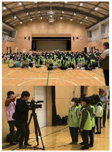
出発式を J.COM が取材