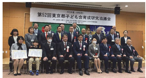
3月28日(木) 全体会議 萌え木ホールにて