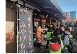
なわて通りで買い物