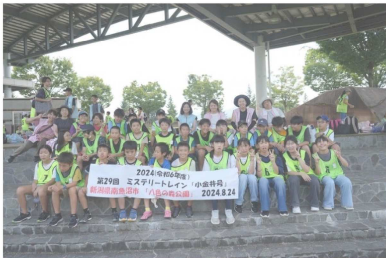
各学校ごとに集合写真