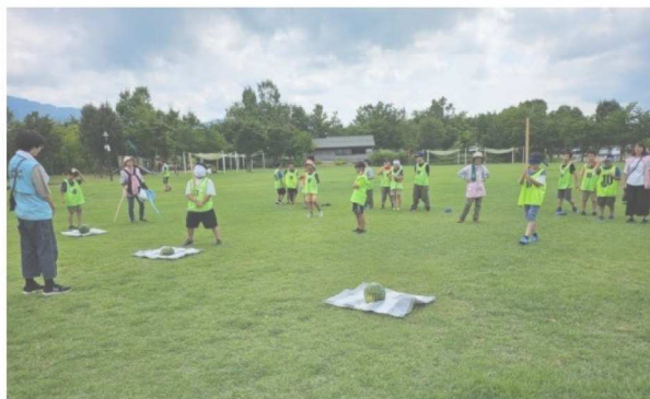
名産やいろスイカ割り!!!